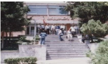
دانشکده مهندسی کامپیوتر، دهه ۱۳۶۰