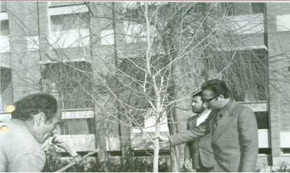
درختکاری در دانشگاه شهید بهشتی، دهه ۱۳۴۰